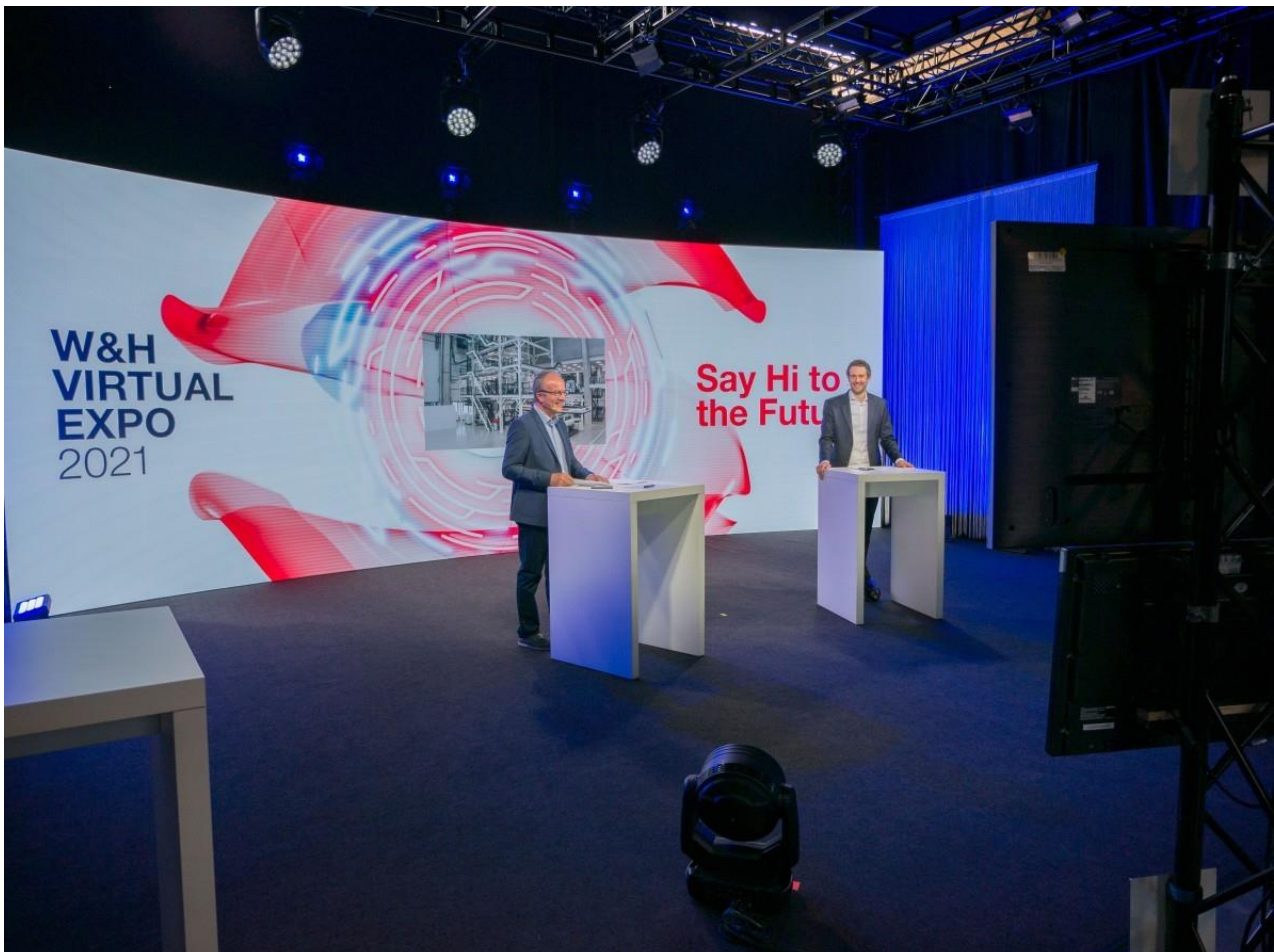
2日間、3分野に渡って開催された、12の技術セッション

「全世界のお客様に対応するために、バーチャルEXPOは1日2回のライブ方式で開催されました。3つの技術アリーナにより構成され、W&H社の専門家によって1つ目はフィルム成膜分野、2つ目は印刷分野、3つ目はコンバーティング分野で、12の異なる技術セッションが開催されました。W&Hの子会社で、紙製袋機械のスペシャリストであるガラント社(Grant)と、FFSテクノロジー分野で積極的な提案を行っているアベンタス社(AVENTUS)も、コンバーティング(加工&パッケージ)の技術アリーナに参加しました。また本バーチャルEXPO中、各セッションに加えて、世界中のW&H社営業担当者が、リアルタイムで個々のお客様とのチャットや相談に対応しました。